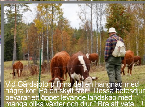
Vid Gårdsjötorp finns det en hängnad med några kor. På en skylt står: "Dessa betesdjur bevarar ett öppet levande landskap med många olika växter och djur." Bra att veta...!