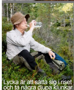
Lycka är att sätta sig i riset och ta några djupa klunkar.