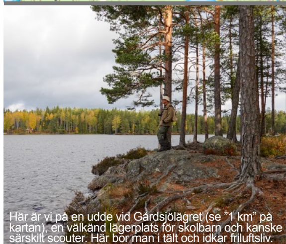
Här är vi på en udde vid Gårdsjölägret (se "1 km" på kartan), en välkänd lägerplats för skolbarn och kanske särskilt scouter. Här bor man i tält och idkar friluftsliv.