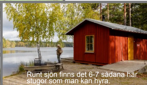
Runt sjön finns det 6-7 sådana här stugor som man kan hyra.