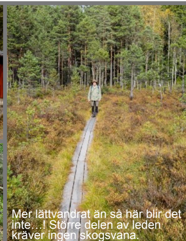
Mer lättvandrad än så här blir det inte...! Större delen av leden kräver ingen skogsvana.