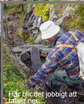
Här blir det jobbigt att ta sig ner.