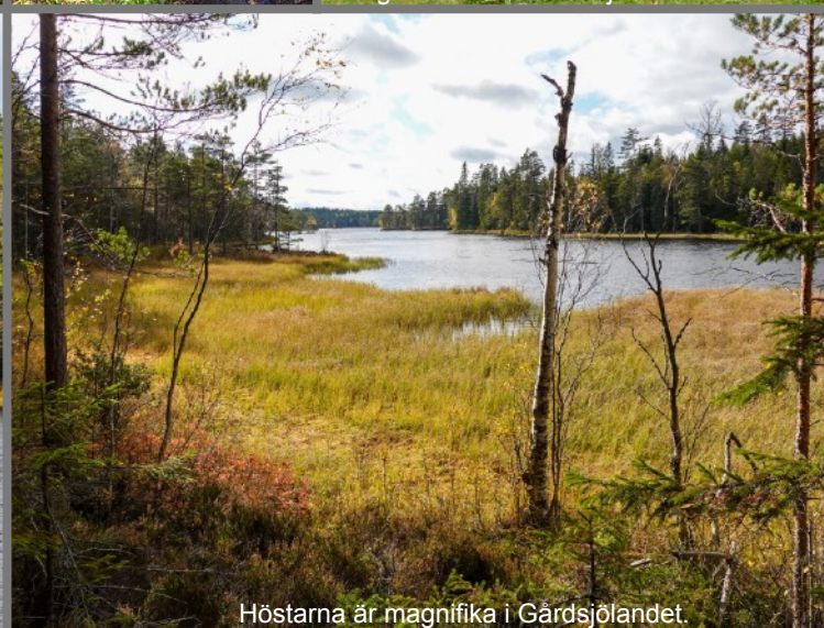
Höstarna är magnifika i Gårdsjölandet.