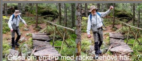
Gissa om en bro med räcke behövs här...?