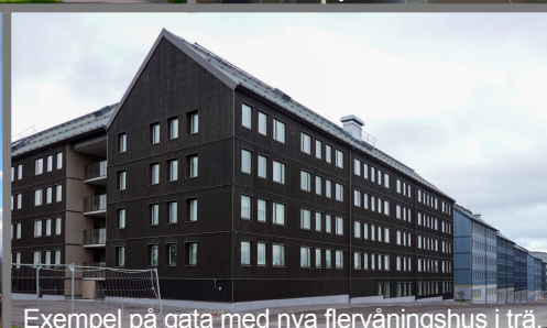
Exempel på gata med nya flervåningshus i trä.