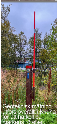
Geoteknisk mätning utförs överallt i Kiruna för att ha koll på markens rörelser.