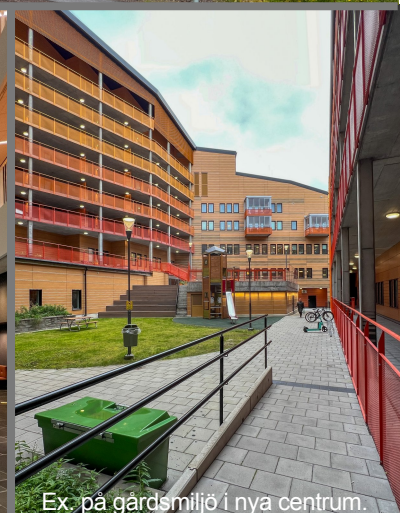
Ex. på gårdsmiljö i nya centrum.