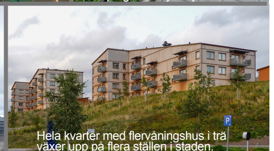
Hela kvarter med flervåningshus i trä växer upp på flera ställen i staden.