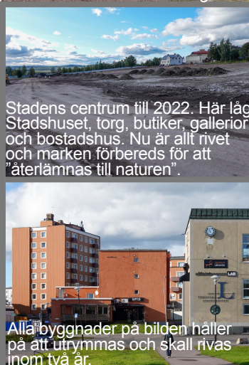
Stadens centrum till 2022. Här låg Stadshuset, torg, butiker, gallerior och bostadshus. Nu är allt rivet och marken förbereds för att "återlämnas till naturen".