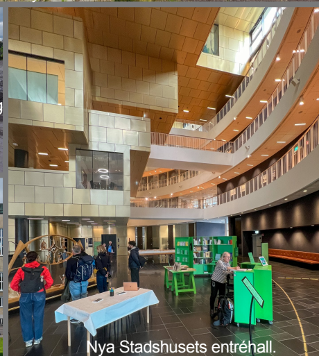
Nya Stadshusets entréhall.