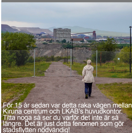
För 15 år sedan var detta raka vägen mellan Kiruna centrum och LKAB's huvudkontor. Titta noga så ser du varför det inte är så längre. Det är just detta fenomen som gör stadsflytten nödvändig!