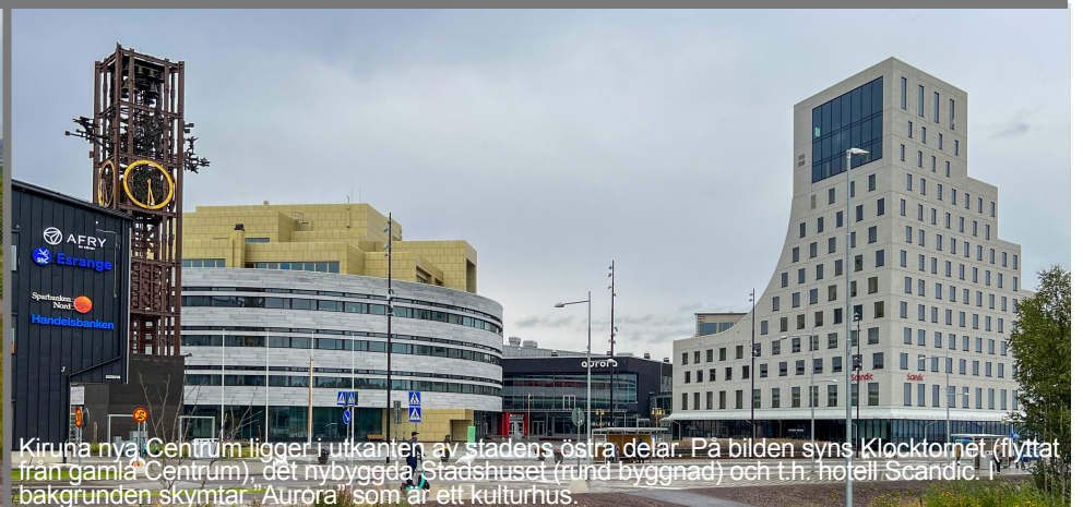
Kiruna nya Centrum ligger i utkanten av stadens östra delar. På bilden syns Klocktornet (flyttat från gamla Centrum), det nybyggda Stadshuset (rund byggnad) och t.ex. hotell Scandic. I bakgrunden skimtar "Aurora" som är ett kulturhus.