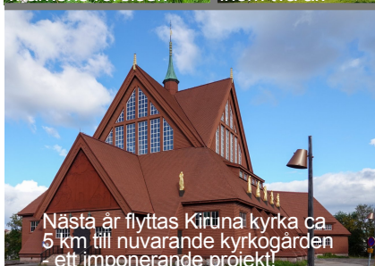
Nästa år flyttas Kiruna kyrka ca 5 km till nuvarande kyrkogården - ett imponerande projekt!