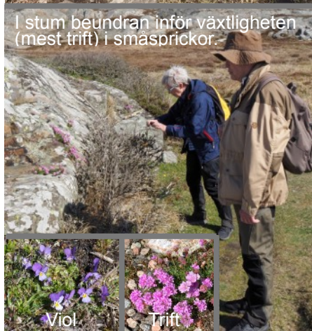
I stum beundran inför växtligheten (mest trift) i småsprickor.