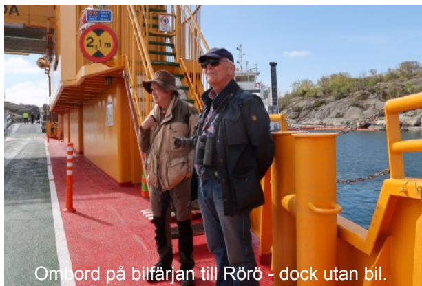
Ombord på bilfärjan till Rörö - dock utan bil.