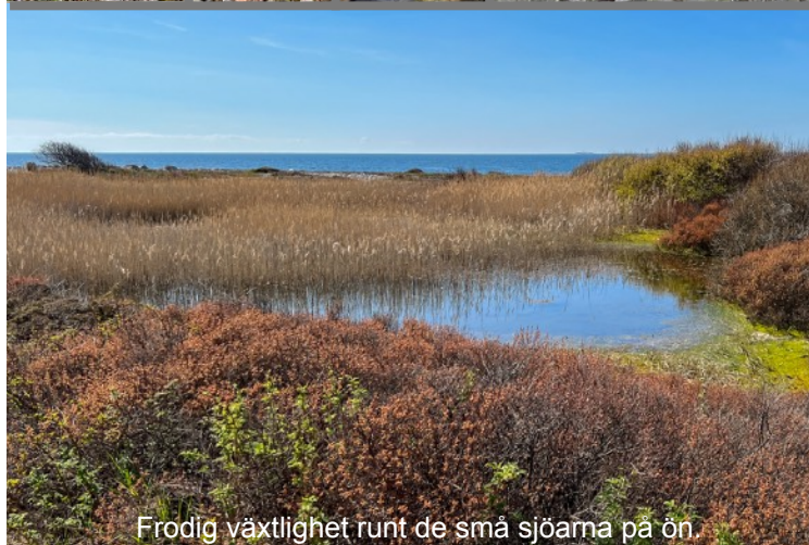
Frodig växtlighet runt de små sjöarna på ön.