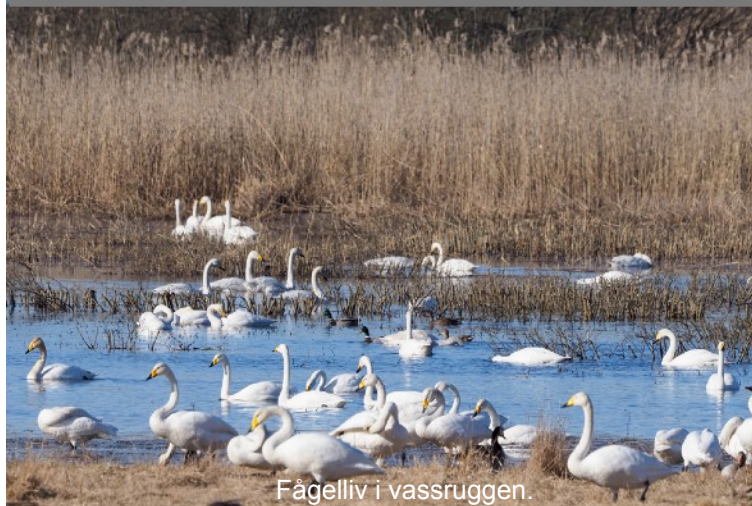
Fågelliv i vassruggen.