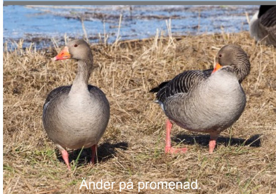
Änder på promenad