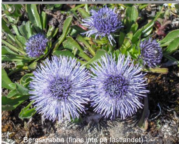
Bergskrabba (finns inte på fastlandet)