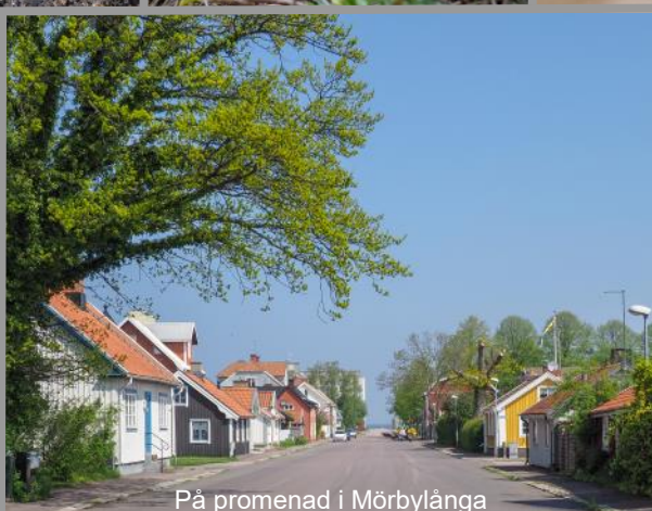
På promenad i Mörbylånga