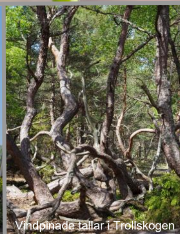
Vindpinade tallar i Trollskogen