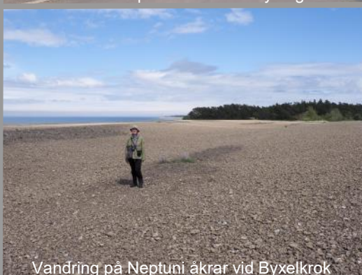
Vandring på Neptuni åkrar vid Byxelkrok