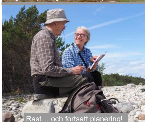
Rast... och fortsatt planering!