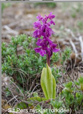
S:1 Pers nycklar (orkidé)