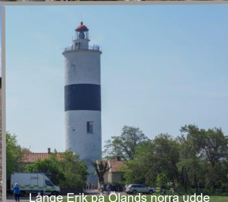
Långe Erik på Ölands norra udde