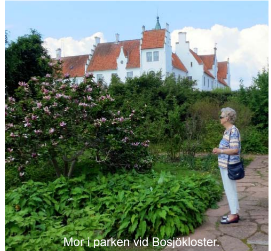
Mor i parken vid Bosjöklöster.