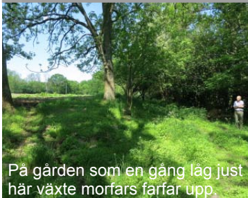
På gården som en gång låg just här växte morfars farfar upp.