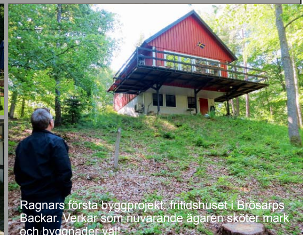
Ragnars första byggprojekt, fritidshuset i Brösarps Backar. Verkar som nuvarande ägaren sköter mark och byggnader väl!