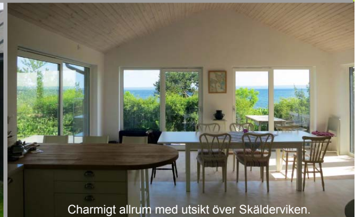
Charmigt allrum med utsikt över Skålderviken.