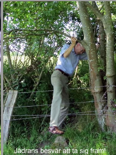
Jädrans besvär att ta sig fram!