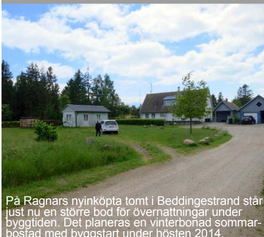
På Ragnars nyinköpta tomt i Beddingestrand står just nu en större bod för övernattnings under byggtiden. Det planeras en vinterbonad sommarbostad med byggstart under hösten 2014.