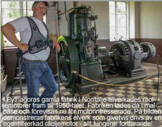
I Pythagoras gamla fabrik i Norrtälje tillverkades räoljmotorer fram till 1950-talet. Fabriken lades då i malpåse och förevisas nu för motorintresserade. På bilden demonstreras fabrikens elverk som givetvis drivs av en egentillverkad räoljmotor - allt fungerar fortfarande!

Tomte Oscarsborg erbjuder en fantastisk utsikt över Söderhamn. Vi fikade ståndsmässigt på Rådhuskonditoriet - en pärla!