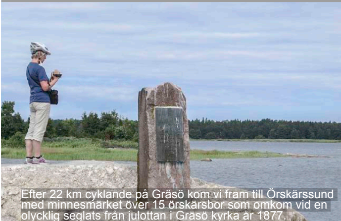
Efter 22 km cyklande på Gräsö kom vi fram till Örskärssund med minnesmärket över 15 örskärabor som omkom vid en olycklig seglats från julottan i Gräsö kyrka år 1877.