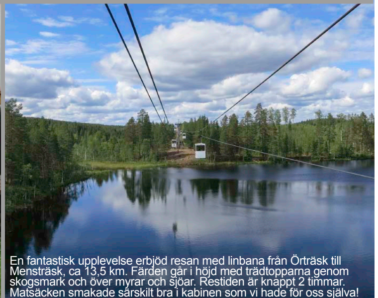
En fantastisk upplevelse erbjöd resan med linbana från Örträsk till Mensträsk, ca 13,5 km. Färden går i höjd med trädtopparna genom skogsmark och över myrar och sjöar. Restiden är knappt 2 timmar. Matsäcken smakade särskilt bra i kabinen som vi hade för oss själva!