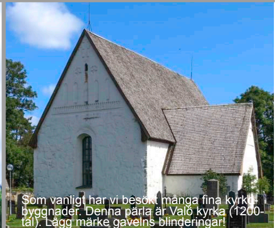
Som vanligt har vi besökt många fina kyrkbyggnader. Denna pärla är Valö kyrka (1200-tal). Lägga märke gavelns blinderingar!