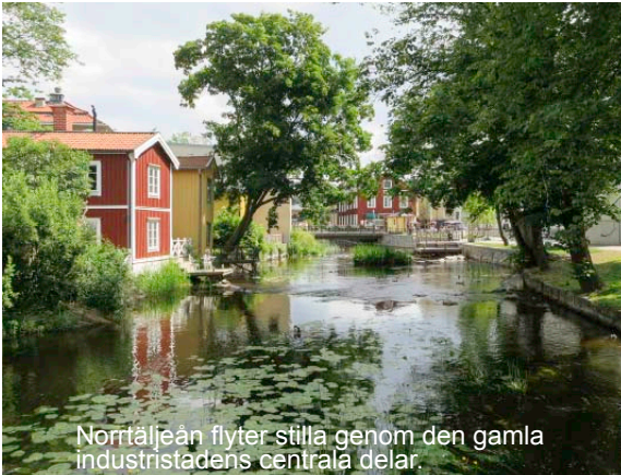
Norräljeån flyter stilla genom den gamla industristadens centrala delar.