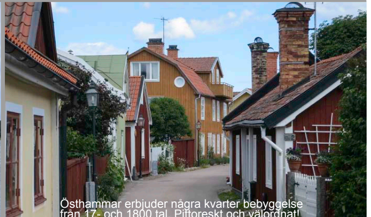
Östhammar erbjuder några kvarter bebyggelse från 17- och 1800 tal. Pittoreskt och välordnat!