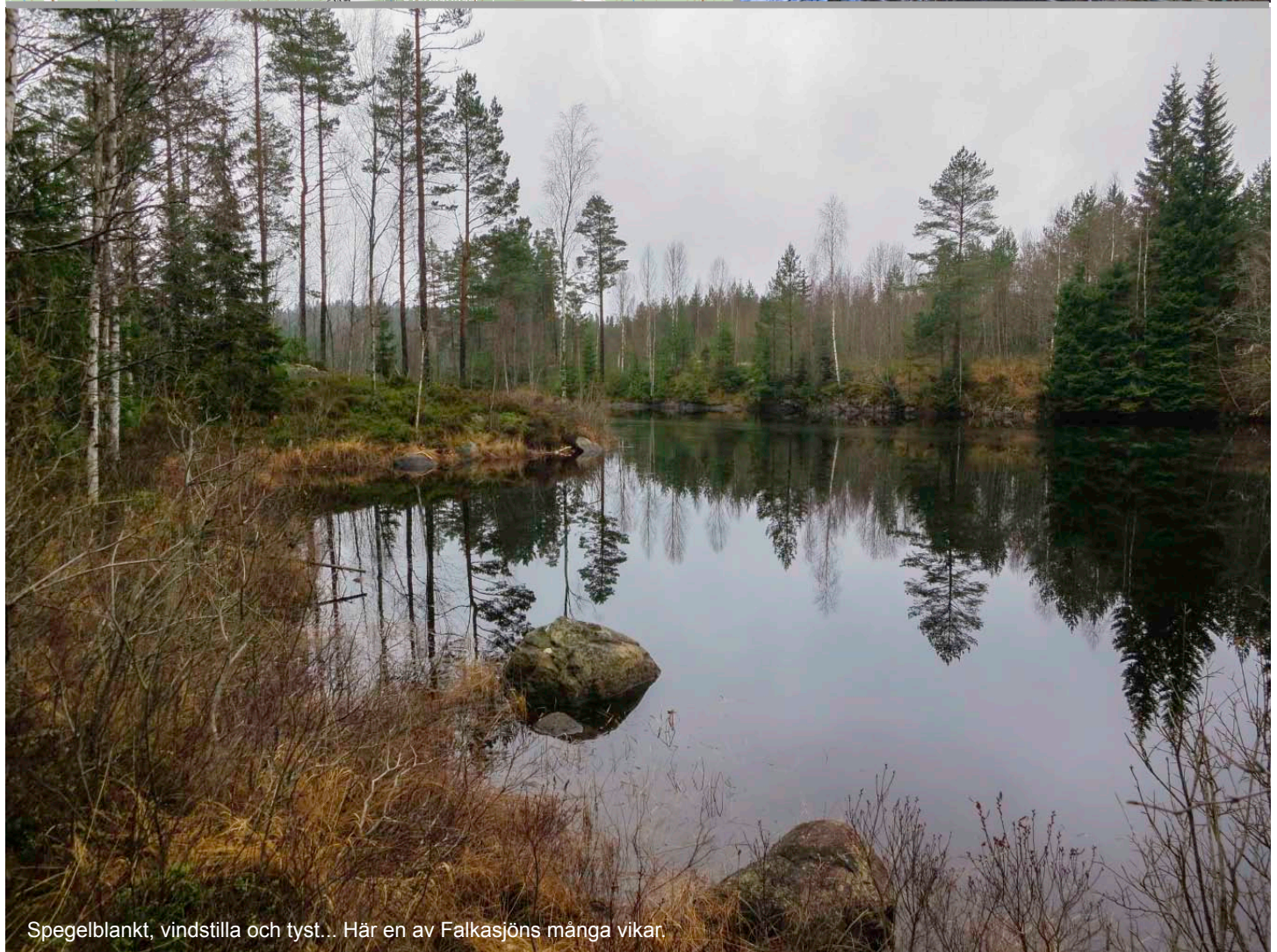
Spegelblankt, vindstilla och tyst... Här en av Falkasjöns många vikar