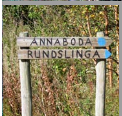
Efter en stunds letande hittar man vägvisaren till "Rundslingan". Numera är dock detta parallellspår tydligt uppmärkt.