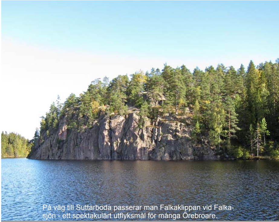
På väg till Suttarboda passerar man Falkaklippan vid Falkasjön - ett spektakulärt utflyktsmål för många Örebroare.