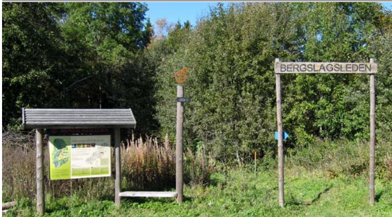
Den fina friluftsgården i Suttarboda där man kunde fika och äta en lättare måltid är ett minne blott. Numera erbjuds en planka t.h. om informationstavlan där den trötte vandraren kan vila sin lekamen och intaga medhavd matsäck.