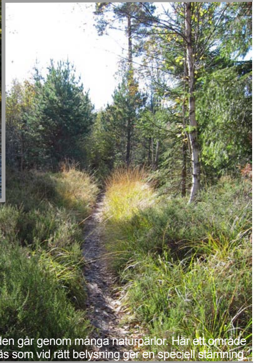
Bergslagsleden går genom många naturpärlor. Här ett område med högt gräs som vid rätt belysning ger en speciell stämning.