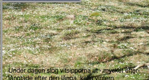
Under dagen slog vitsipporna ut - mycket efterlängtrade efter den långa, kalla vintern