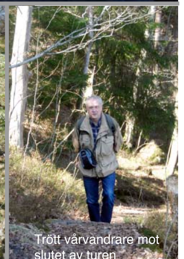
Trött vårvandrare mot slutet av turen