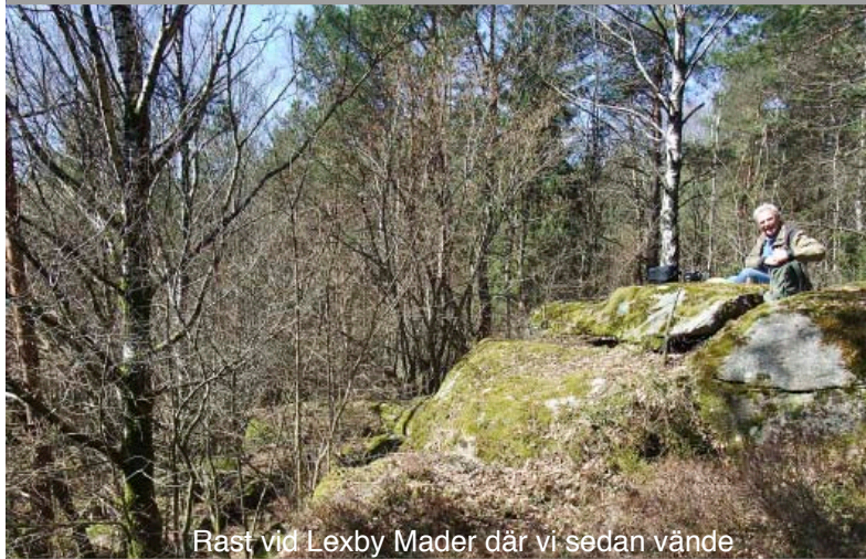
Rast vid Lexby Mader där vi sedan vände