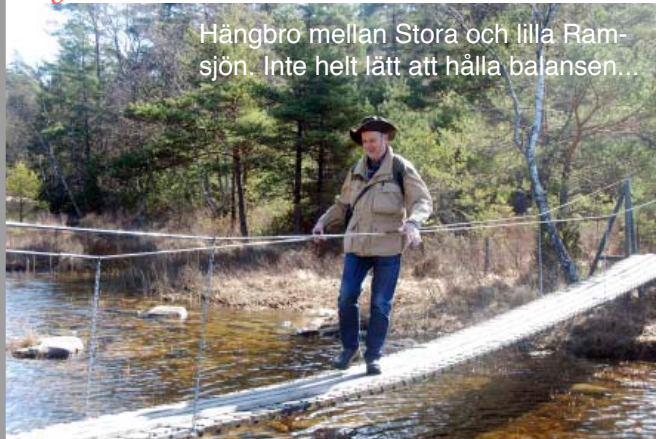
Hängbro mellan Stora och lilla Ramsjön. Inte helt lätt att hålla balansen...