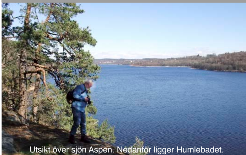
Utsikt över sjön Aspen. Nedanför ligger Humlebadet.