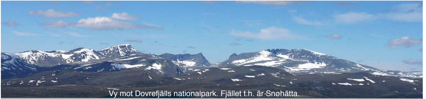
Vy mot Dovrefjälls nationalpark. Fjället t.h. är Snöhätta.