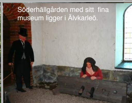
Söderhällgården med sitt fina museum ligger i Älvkarleö.