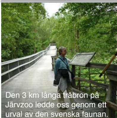
Den 3 km långa träbron på Järvsö ledde oss genom ett urval av den svenska faunan.