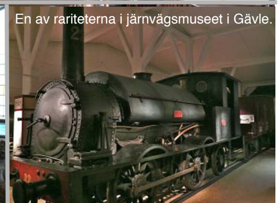
En av rariteterna i järnvägmuseet i Gävle.