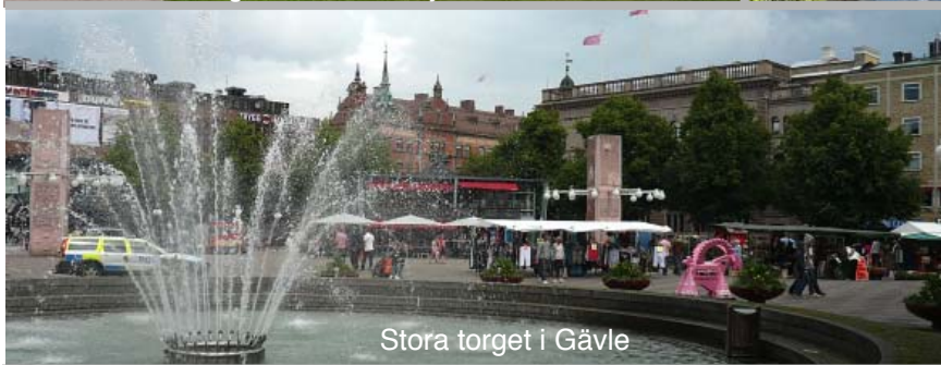
Stora torget i Gävle