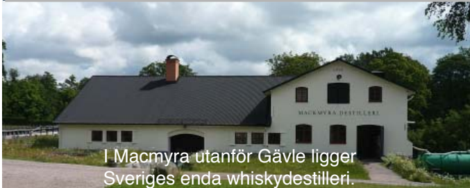
I Måcmyra utanför Gävle ligger Sveriges enda whiskydestilleri.