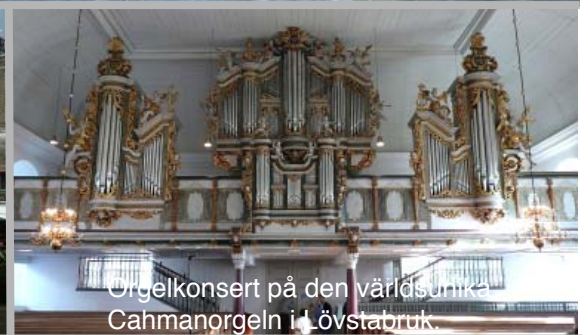
Orgelkonsert på den världsunika Cahmanorgeln i Lövstabruk.