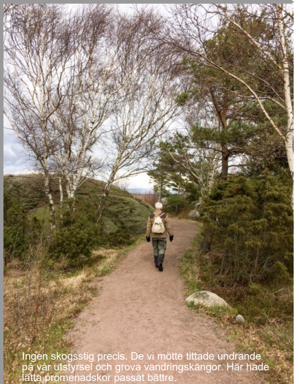
Ingen skogsstig precis. De vi mötte tittade undrande på vår utstyrsel och grova vandringskängor. Här hade lätta promenadskor passat bättre.