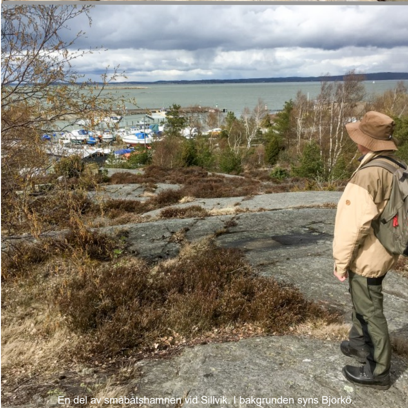
En del av småbåtshamnen vid Sillvik. I bakgrunden syns Björkö.