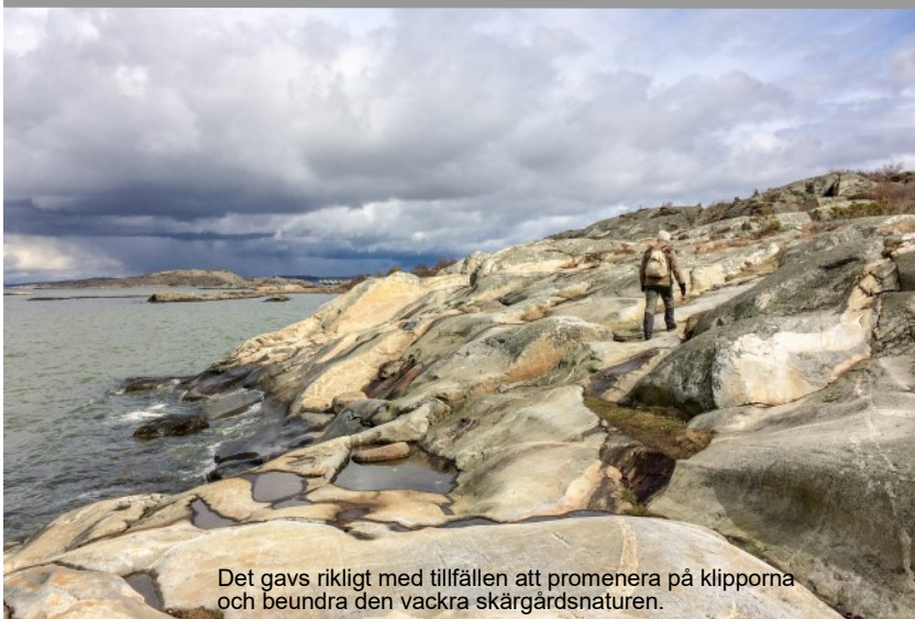
Det gavs rikligt med tillfällen att promenera på klipporna och beundra den vackra skärgårdsnaturen.