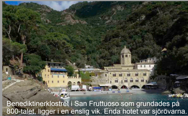
Benediktinerklostret i San Fruttuoso som grundades på 800-talet, ligger i en enslig vik. Enda hotellet var sjöörvarna.