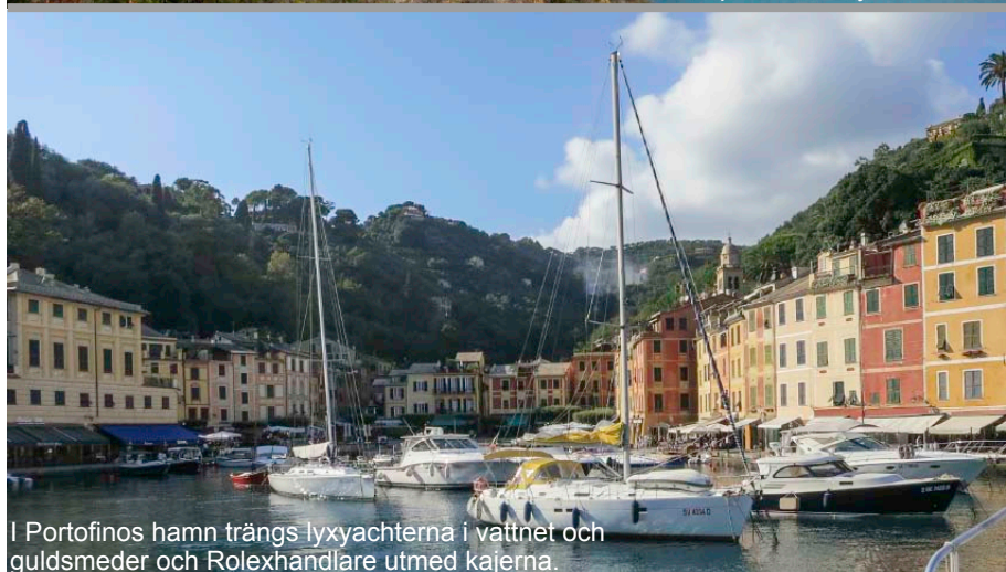
I Portofinos hamn trängs lyxyachtarna i vattnet och guldsmeder och Rolex-handlare utmed kajerna.