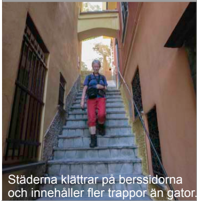
Städerna klättrar på berssidorna och innehåller fler trappor än gator.