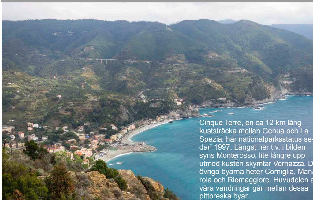
Cinque Terre, en ca 12 km lång kuststräcka mellan Genua och La Spezia, har nationalparksstatus sedan 1997. Längst ner t.v. i bilden syns Monterosso, lite längre upp utmed kusten skymtar Vernazza. De övriga byarna heter Corniglia, Manarola och Riomaggiore. Huvuddelen av våra vandringar går mellan dessa pittoreska byar.