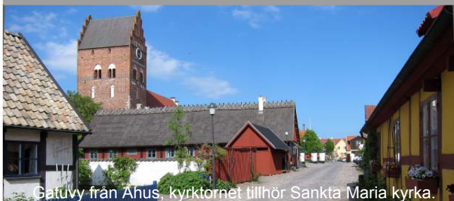
Gatuvy från Åhus, kyrktornet tillhör Sankta Maria kyrka.