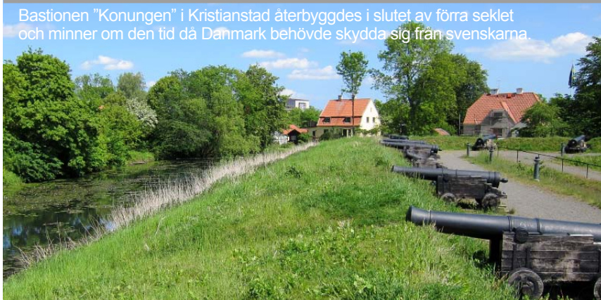
Bastionen "Konungen" i Kristianstad återbyggdes i slutet av förra seklet och minner om den tid då Danmark behövde skydda sig från svenskarna.