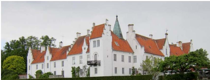
Bosjökloster, vy från Ringsjön. Slottets nuvarande utseende är huvudsakligen en produkt av 1800-talets arkitektoniska strömningar.