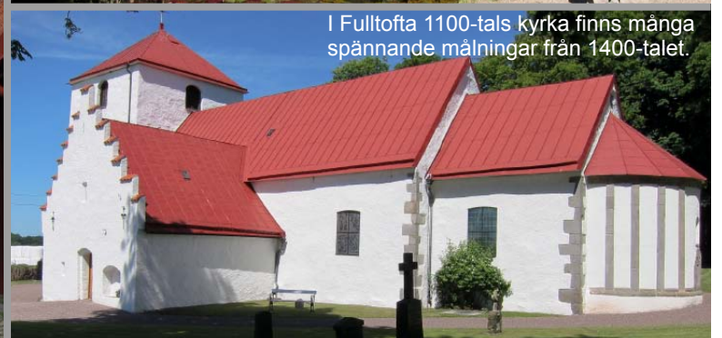
I Fulltofta 1100-tals kyrka finns många spännande målningar från 1400-talet.