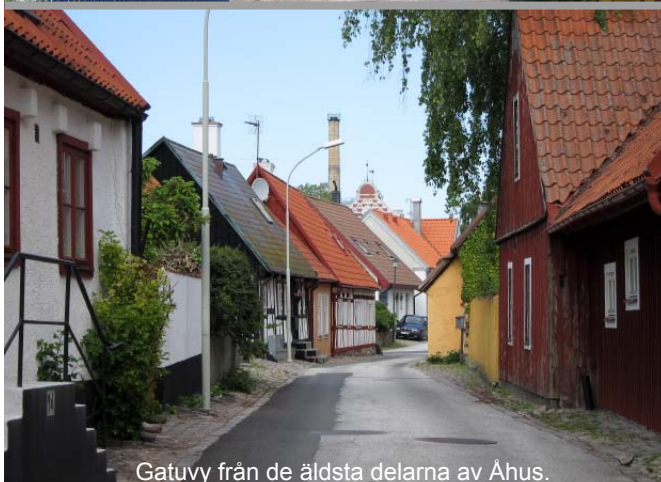
Gatuvy från de äldsta delarna av Åhus.