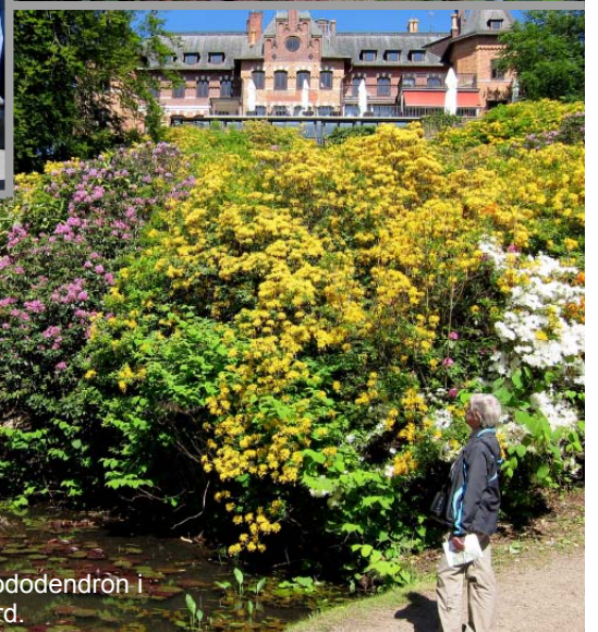
Ing-Britt beundrar rhododendron i Sofieros slottsträdgård.