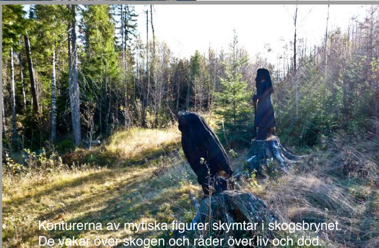
Konturerna av mytiska figurer skymtar i skogsbrynet. De vakar över skogen och råder över liv och död.