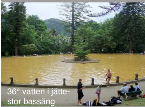
36° vatten i jättestor bassäng