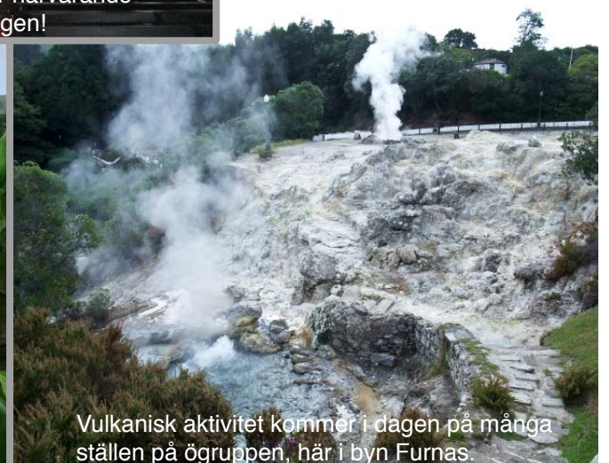
Vulkanisk aktivitet kommer i dagen på många ställen på ögruppen, här i byn Furnas.