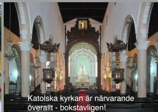
Katolska kyrkan är närvarande överallt - bokstavligen!