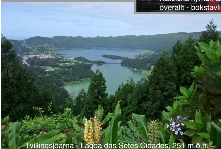
Tvillingsjöarna - Lagoa das Setes Cidades, 251 m.ö.h.