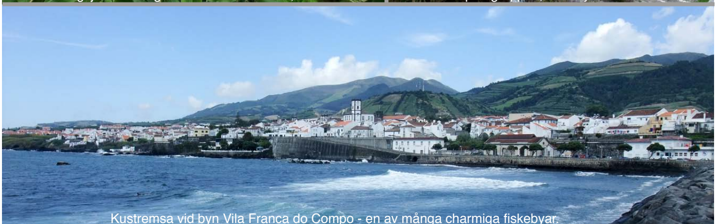
Kustrensa vid byn Vila Franca do Compo - en av många charmiga fiskebyar.