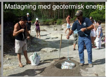
Matlagning med geotermisk energi.