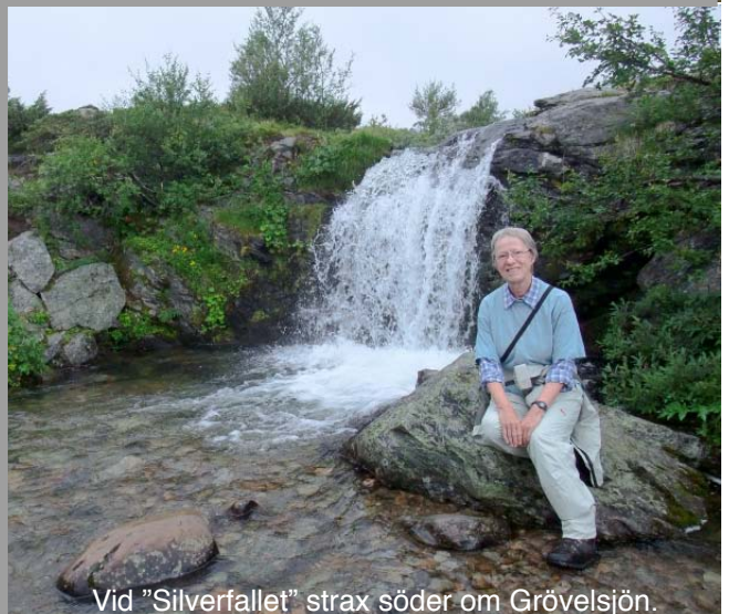
Vid "Silverfallet" strax söder om Grövelsjön.