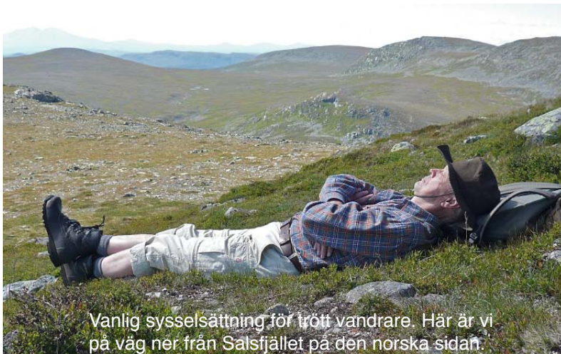
Vanlig sysselsättning för trött vandrare. Här är vi på väg ner från Salsfjället på den norska sidan.