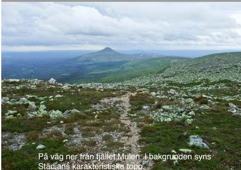
På väg ner från fjället Mula. I bakgrunden syns Städjans karakteristiska topp.