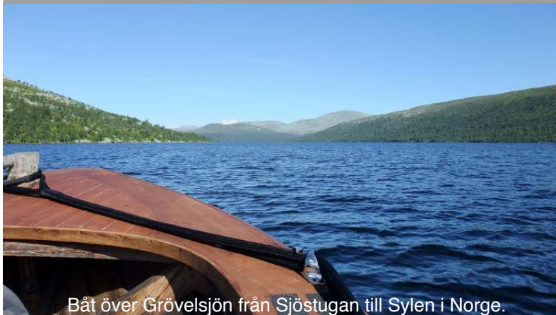
Båt över Grövelsjön från Sjöstugan till Sylen i Norge.