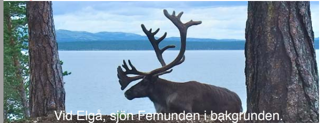
Vid Elgå, sjön Femunden i bakgrunden.