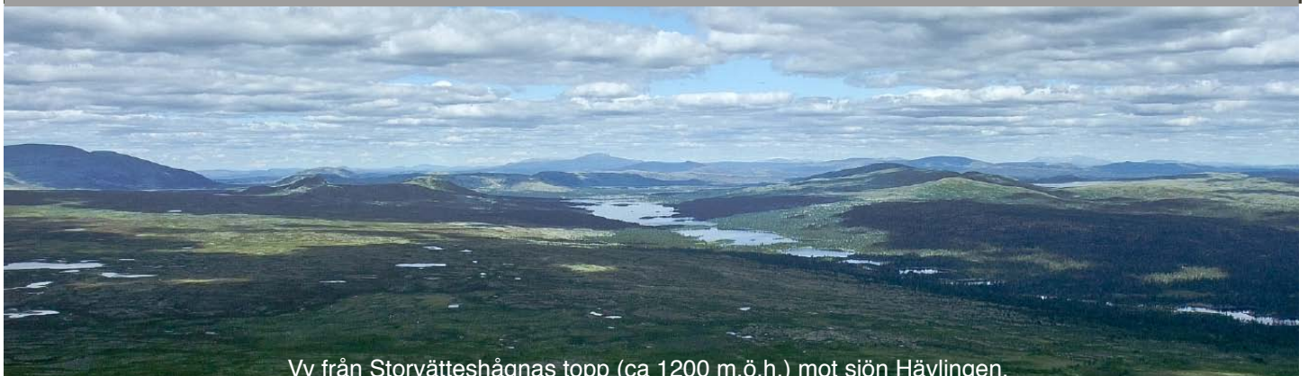
Vy från Störvätteshågnas topp (ca 1200 m.ö.h.) mot sjön Hävlingen.