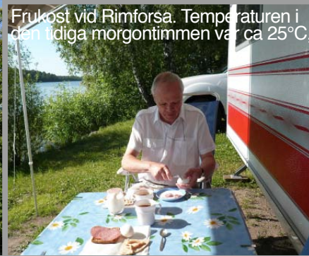
Frukost vid Rimforså. Temperaturen i den tidiga morgontimmen var ca 25°C.