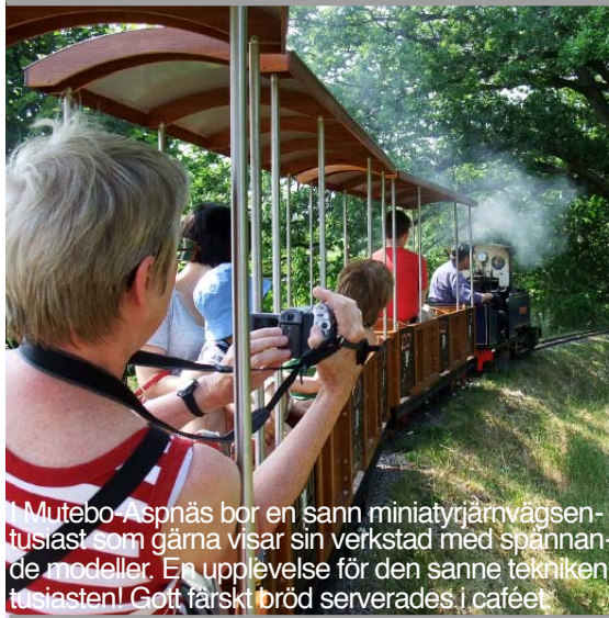
I Mutebo Aspås bor en sann miniatyrjärnvägsentusiast som gärna visar sin verkstad med spännande modeller. En upplevelse för den sanne tekniktusiasten! Gott färsikt bröd serverades i caféet.