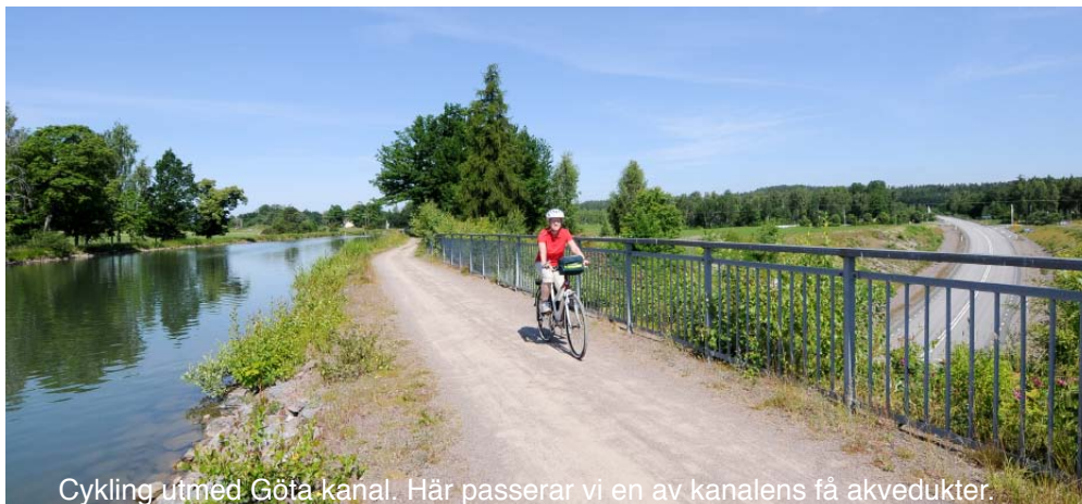
Cykling utmed Göta kanal. Här passerar vi en av kanalens få akvedukter.