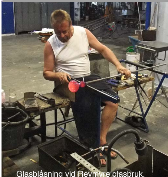
Glasblåsning vid Reymyre glasbruk.