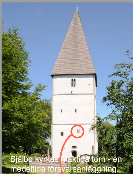
Bjälbo kyrkas maktiga torn - en medeltida försvarsanläggning.