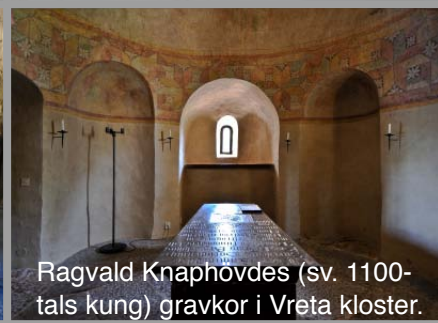
Ragvald Knaphövdes (sv. 1100-tals kung) gravkor i Vreta kloster.