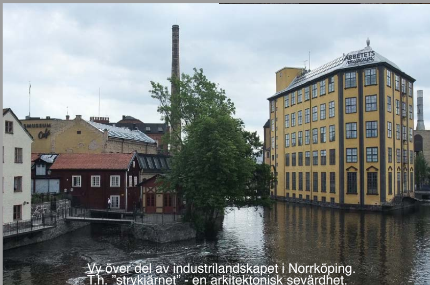
Vy över del av industrilandskapet i Norrköping. T.h. "strykjärnet" - en arkitektonisk sevärdhet.