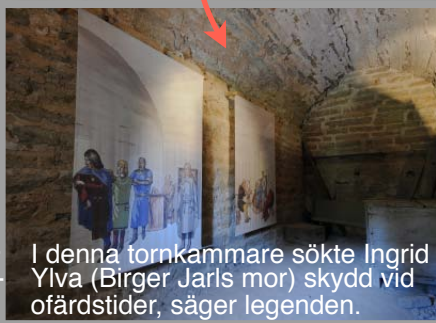
I denna tornkammare sökte Ingrid Ylva (Birger Jarls mor) skydd vid ofärdstider, säger legenden.