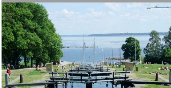
Slussarna vid Berg. I bakgrunden sjön Roxen.