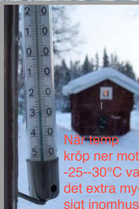
När temp kröp ner mot -25--30°C var det extra mysigt inomhus.