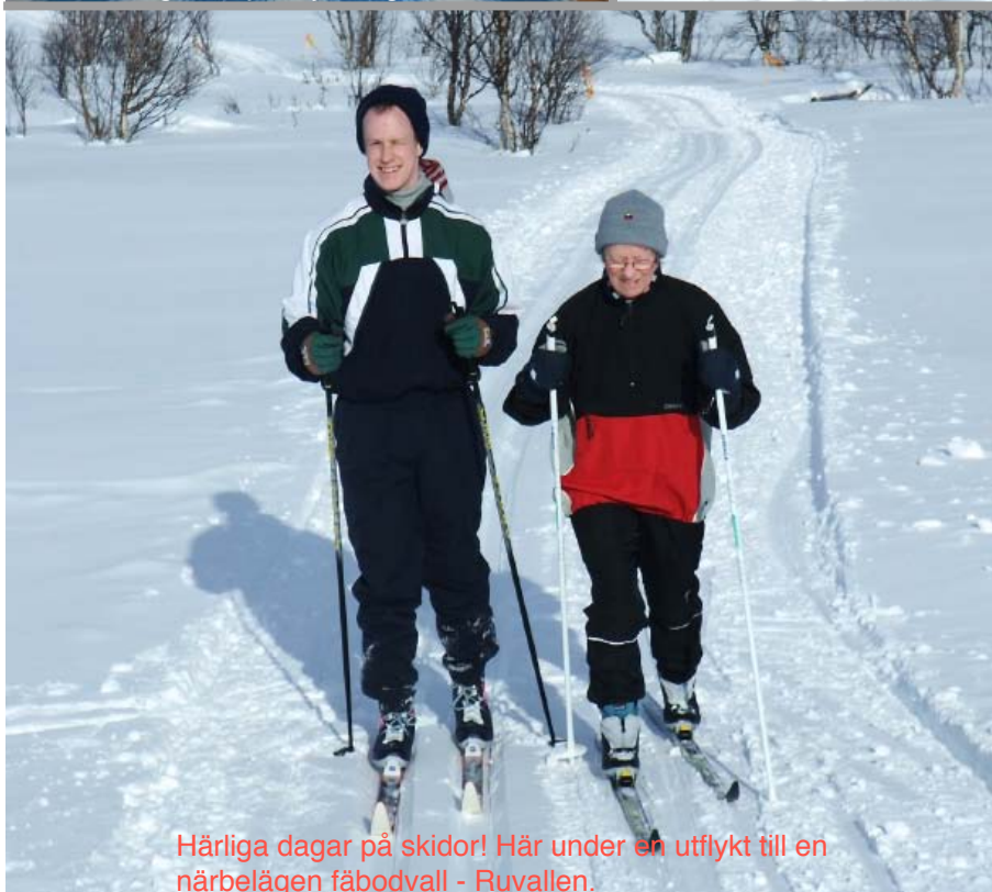
Härliga dagar på skidor! Här under en utflykt till en närbelägen fåbodvall - Ruvalen.