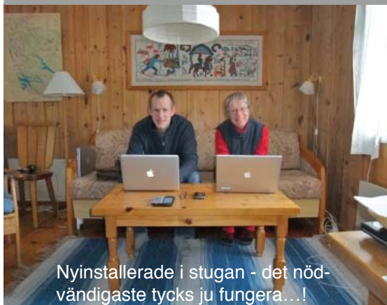
Nyinstallerade i stugan - det nödvändigaste tycks ju fungera...!