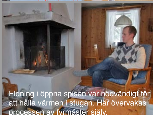
Eldning i öppna spisen var nödvändigt för att hålla värmen i stugan. Här övervakas processen av fyrmästar själv.