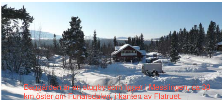
Baggården är en stugby som ligger i Messlingen, ca 30 km öster om Funarisdalen, i kanfen av Flatruet.