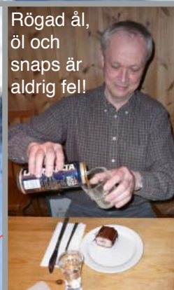
Rögd ål, öl och snaps är aldrig fel!