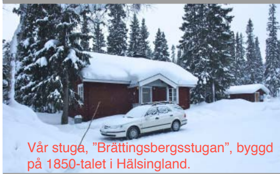
Vår stuga, "Brättingsbergsstugan", byggd på 1850-talet i Hälsingland.