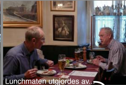
Lunchmaten utgjordes av...