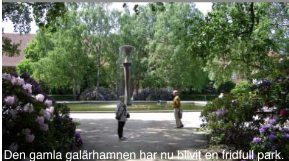
Den gamla galärhamnen har nu blivit en fridfull park.