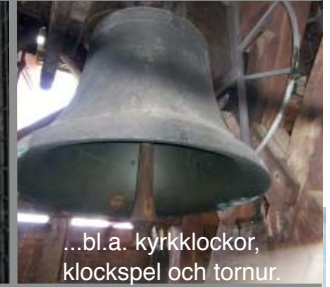
...bl.a. kyrkklockor, klockspel och tornur.