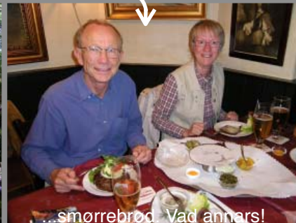
...smørrebrød. Vad annars!