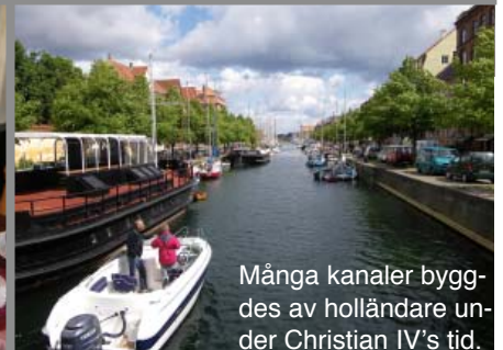
Många kanaler byggdes av holländare under Christian IV's tid.