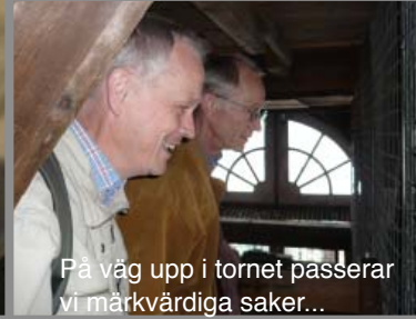
På väg upp i tornet passerar vi märkvärdiga saker...