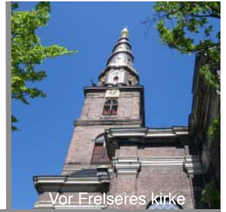
Vor Frelseres kirke