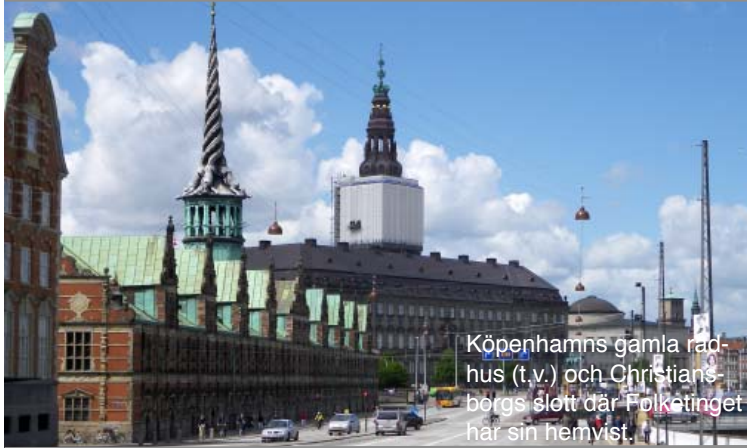
Köpenhamns gamla rådhus (t.v.) och Christiansborgs slott där Folketinget har sin hemvist.