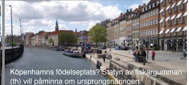
Köpenhamns födelseplats? Statyn av fiskargumman (th) vill påminna om ursprungsnäringsen.