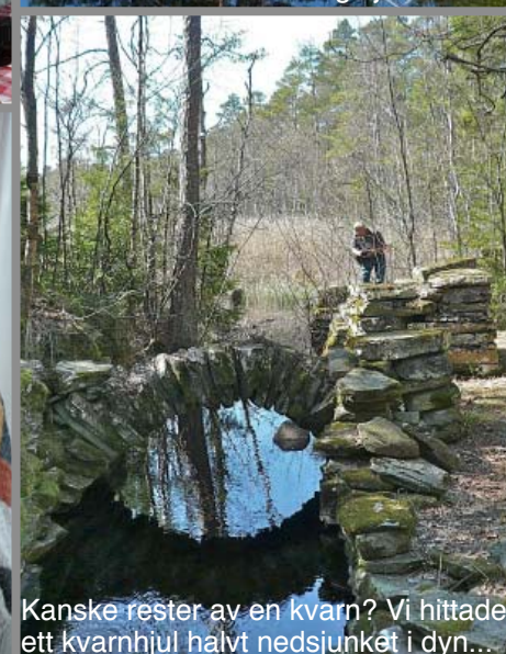
Kanske rester av en kvarn? Vi hittade ett kvarnhjul halvt nedsjunket i dyn...