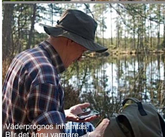
Väderprognos inhämtas. Bli det ännu varmare...?