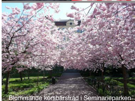
Blommande körsbärsträd i Seminarieparken