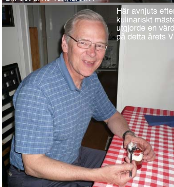
Här avnjuts efterrätten - ett kulinariskt mästerverk som utgjorde en värdig avslutning på detta årets Vårvandring.