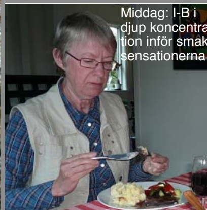
Middag: I-B i djup koncentration inför smaksensationerna