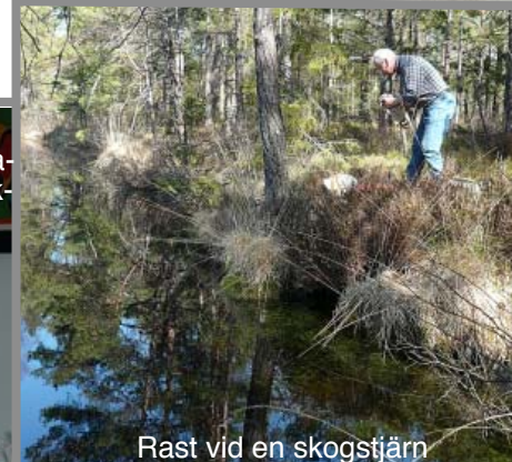
Rast vid en skogstjärn