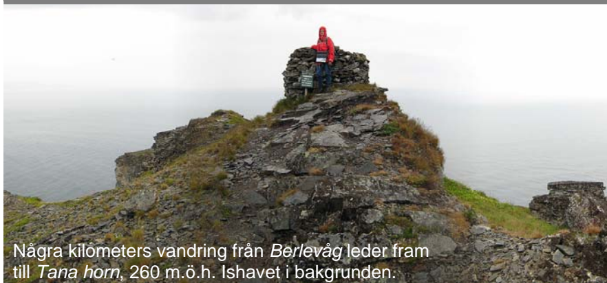
Några kilometers vandring från Berlevåg leder fram till Tana horn, 260 m.ö.h. Ishavet i bakgrunden.