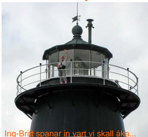
Ing-Britt spanar in vart vi skall åka...