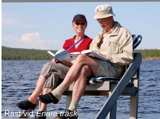
Rast vid Enare träsk