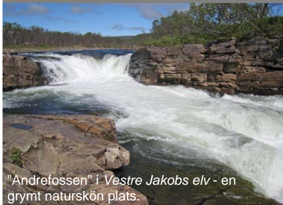
"Andrefossen" i Vestre Jakobs elv - en grymt naturskön plats.