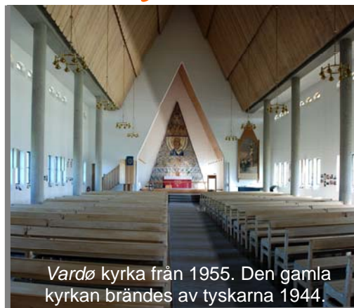
Vardø kyrka från 1955. Den gamla kyrkan brändes av tyskarna 1944.