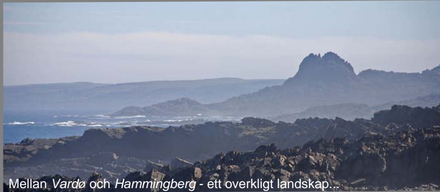
Mellan Vardø och Hammingberg - ett överkligt landskap...