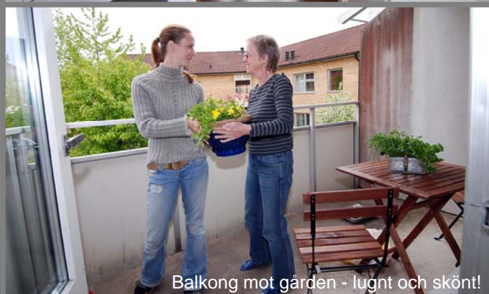
Balkong mot gården - lugnt och skönt!