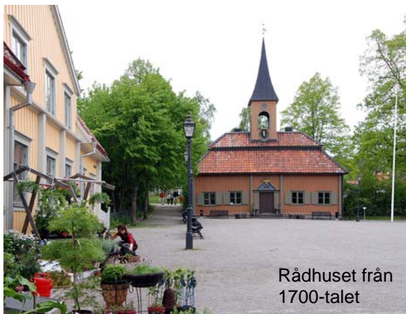
Rådhuset från 1700-talet