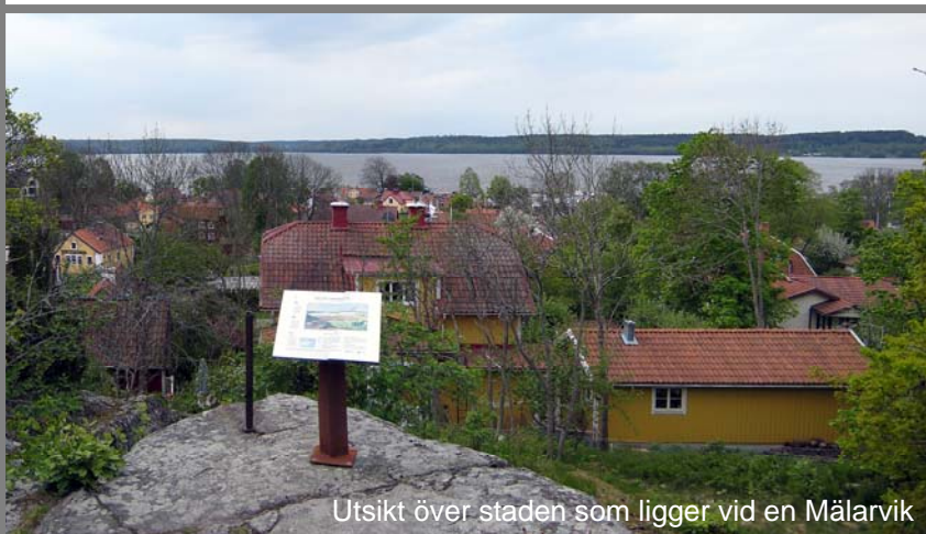
Utsikt över staden som ligger vid en Mälarvik