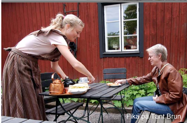
Fika på Tant Brun