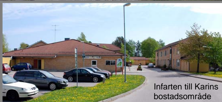
Infarten till Karins bostadsområde