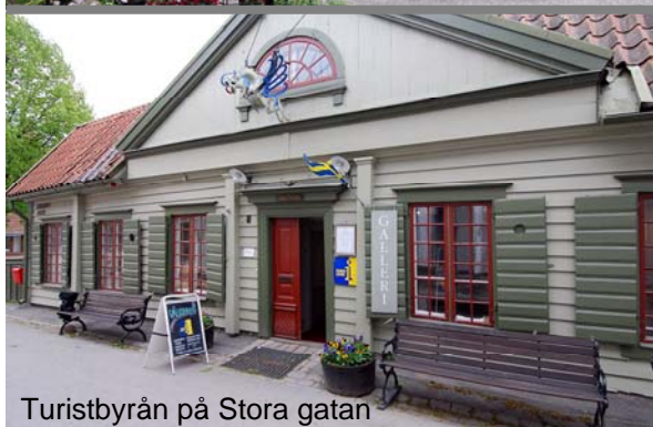
Turistbyrån på Stora gatan