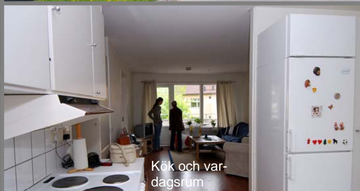
Kök och vardagsrum

Vardagsrummet. Ingången till sovrummet syns t.v.