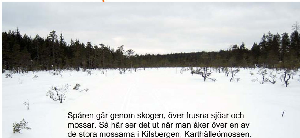
Spåren går genom skogen, över frusna sjöar och mossar. Så här ser det ut när man åker över en av de stora mossarna i Kilsbergen, Karthälleö mossen.