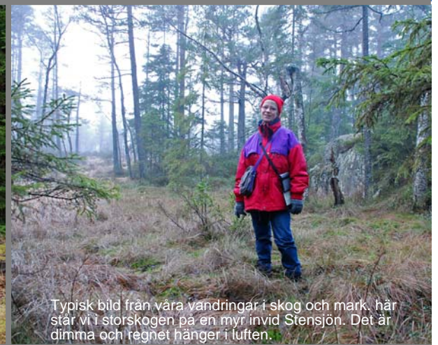
Typisk bild från våra vandringar i skog och mark, här står vi i storskogen på en myr invid Stensjön. Det är dimma och regnet hänger i luften.