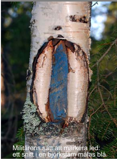
Militärens sätt att markera led: ett snitt i en björkstam målas blå.