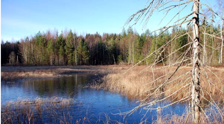
Svårt att tänka sig att det är januari. Ingen snö, +5 grader och sol från klar himmel!