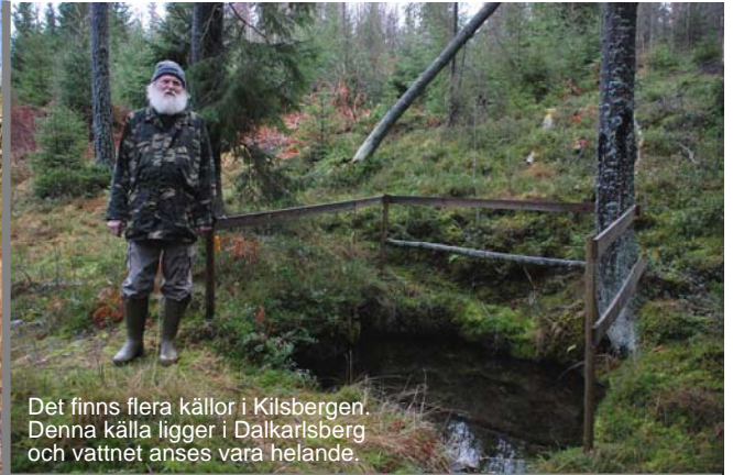
Det finns flera källor i Kilsbergen. Denna källa ligger i Dalkarlsberg och vattnet anses vara helande.