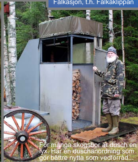
För många skogsbor är dusch en lyx. Här en duschanordning som gör bättre nytta som vedförråd...