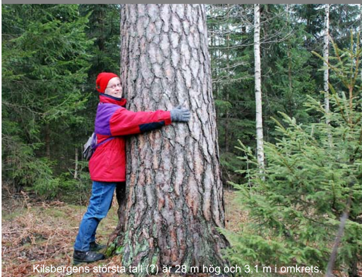
Kilsbergens största tall (?) är 28 m hög och 3,1 m i omkrets.