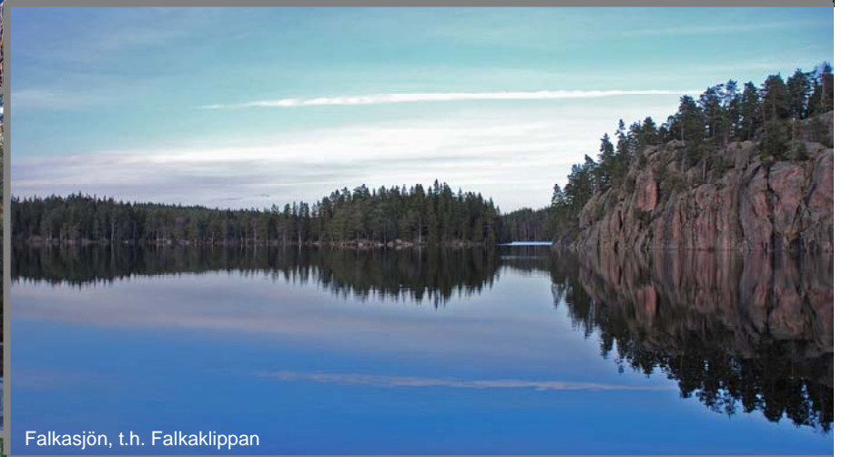
Falkasjön, t.h. Falkaklippan