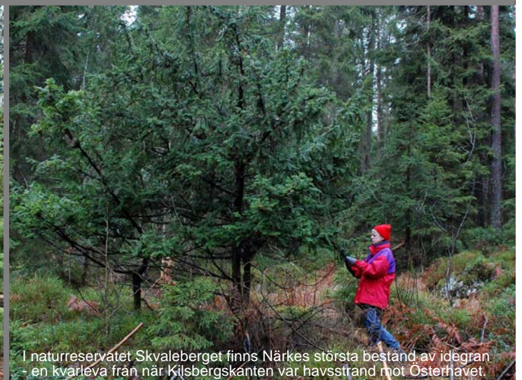
I naturreservatet Skvaleberget finns Närkes största bestånd av idegran - en kvarleva från när Kilsbergskanten var havsstrand mot Östernhavet.