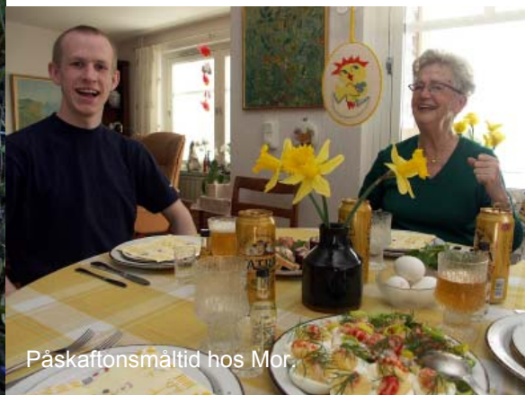
Påskaffonsmåltid hos Mor.