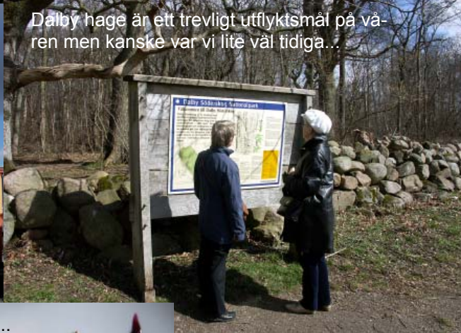
Dalby hage är ett trevligt utflyktsmål på våren men kanske var vi lite väl tidiga...