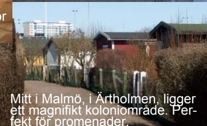
Mitt i Malmö, i Ärholmen, ligger ett magnifikt koloniområde. Perfekt för promenader.