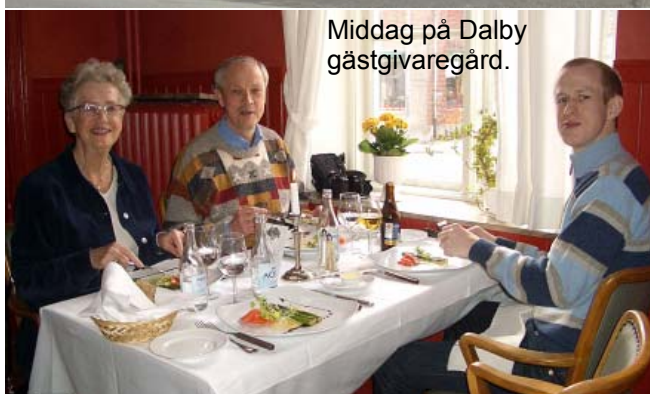
Middag på Dalby gästgivaregård.