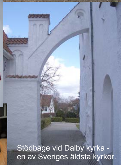
Stödbåge vid Dalby kyrka - en av Sveriges äldsta kyrkor.