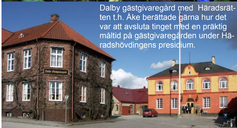
Dalby gästgivaregård med Häradsrätten t.h. Åke berättade gärna hur det var att avsluta tinget med en präktig måltid på gästgivaregården under Häradsrättshövdingens presidium.