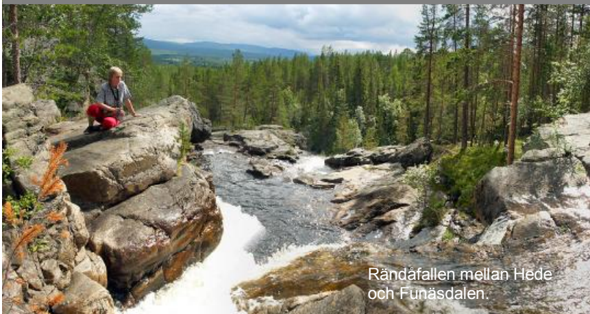
Rändåfallen mellan Hede och Funäsdalen.