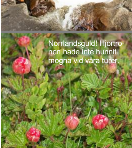
Norrlandsguld! Hjortronen hade inte hunnit mogna vid våra turer.