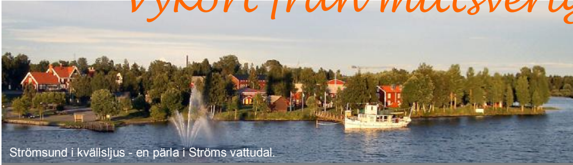
Strömsund i kvällsljus - en pärla i Ströms vattudal.