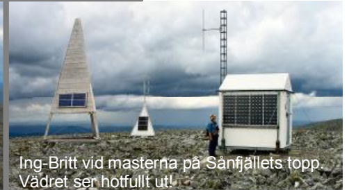
Ing-Britt vid masterna på Sånfjällets topp. Vädret ser hotfullt ut!