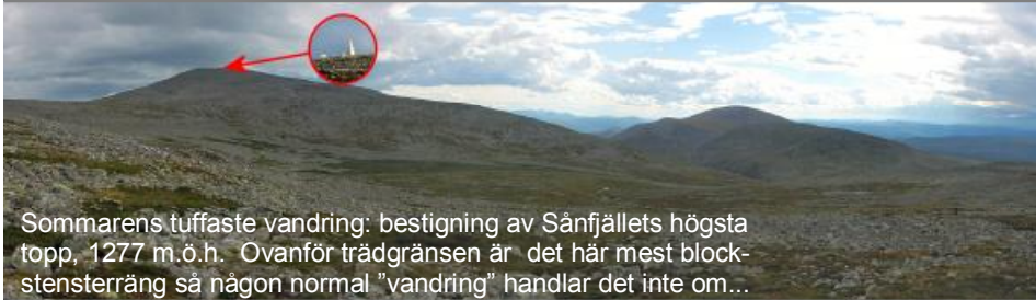
Sommarens tuffaste vandring: bestigning av Sånfjällets högsta topp, 1277 m.ö.h. Ovanför trädgränsen är det här mest blockstensterräng så någon normal "vandring" handlar det inte om...

Här kommer sista hälsningen från vår sommarsemester. Efter 5 veckor i husvagnen skall det nu bli skönt att komma hem igen!