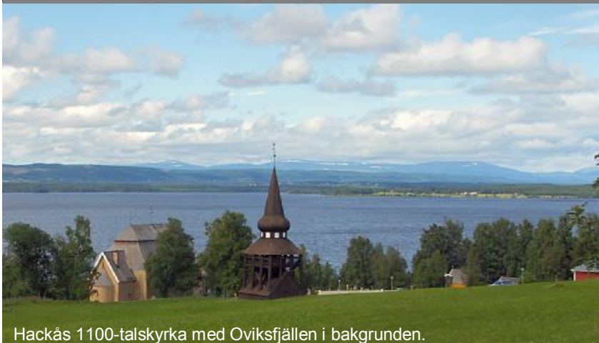
Hackås 1100-talskyrka med Oviksfjällen i bakgrunden.

Bertil pustar ut på toppen av Särvfjället, 1170 m.ö.h. T.h. syns en del av topproset.